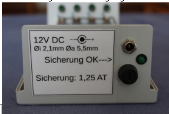
Beschriftung der Spannungsversorgung