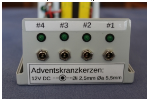
Beschriftung der LED-Ausgänge