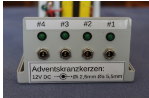
Beschriftung der LED-Ausgänge